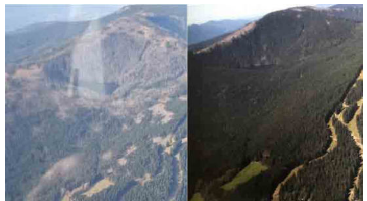
Jezerní hora v Národní rezervaci Černé a Čertovo jezera - srovnání stavu listopad 2024 a 2009