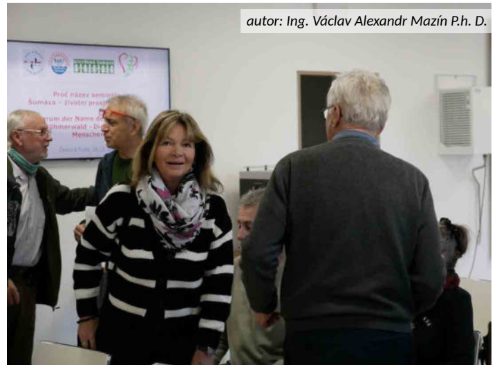
autor: Ing. Václav Alexandr Mazín P.h. D.

regionu, kteří získali nový pohled na ochranu přírody a život lidí v Královském hvozdu. I když závěry informací o stavu lesů a životního prostředí člověka na Šumavě působily na účastníky semináře skepticky a bez východiska, shodli se na tom, že pro ně bylo přínosem o těchto věcech mluvit a sdílet se s místní komunitou i veřejností.