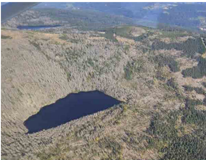
Stav lesních společenstev v Národní přírodní rezervaci Černé a Čertovo jezero (foto František Vrbas, Otevřená Šumava z.s. Špičák, listopad 2024)

Co říci závěrem. Občanské sdružení Otevřená Šumava z.s. pořádalo v roce 2012 seminář na obdobné téma v Bavorské Rudě - Arberlandhalle, a tak se nabízí srovnání po dvanácti letech. Jednak ve stavu šumavských a bavorských lesů, kde je dlouhodobě praktikovaná v chráněných územích bezzásahovost a vedle toho zájem veřejnosti, a především zástupců samosprávy obcí. Stav lesů se z odborného stanoviska lesních hospodářů a výsledků pozorování zhoršil a kůrovec nejen neustoupil, ale rozšířil se na další plochy a samovolné zmlazení lesa je přinejmenším problematické s nejistým koncem. Tuto skutečnost doložili členové Otevřené Šumavy z.s. vlastními leteckými snímky a pozemní fotodokumentací Královského hvozdu z lokality Národního přírodního parku Černého a Čertova jezera.